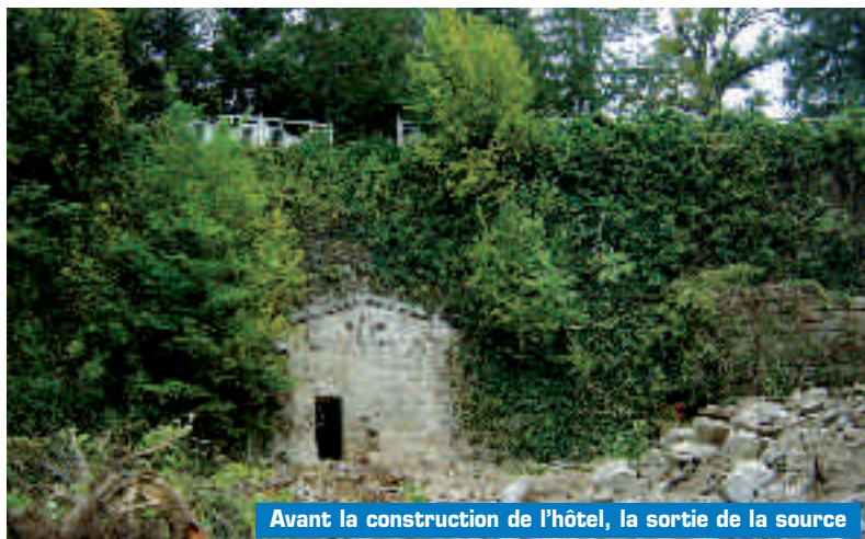
Avant la construction de l'hôtel, la sortie de la source

«En 1773 une épizootie, qui ravagea plusieurs provinces de la France, sévissait sur les bestiaux. M. de Marsonnat remarqua que ceux qui avaient bu l'eau minérale furent exempts du fléau. Cinq ans plus tard, en 1778, le directeur des diligences de Lyon à Paris envoyait tous les matins, des chevaux atteints du farcin. «on les forçait à boire de l'eau minérale en les privant de toute autre boisson : ces chevaux guérirent.» Ainsi fut découverte la Source. (...)