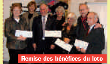
Remise des bénéfices du loto

implantée à Charbonnières ; - Parrainage d'adolescents en décrochage scolaire (soutien dans le cadre d'une orientation professionnelle) ; - Participation à la collecte alimentaire des Restaurants du Cœur, dite «Chariots bébés».