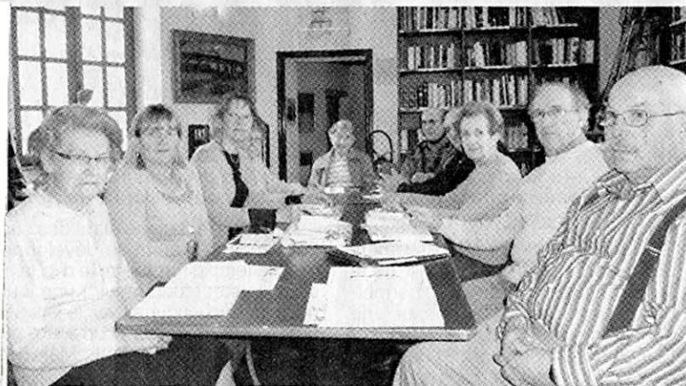
Le conseil d'administration de la Société d'Histoire a abordé le programme des animations qu'elle organise ou auxquelles elle participe à l'occasion des Mousselines